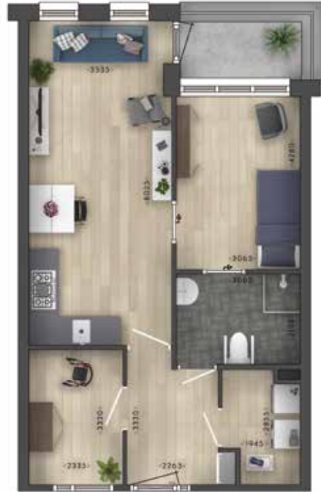
Voorbeeld van een appartement. Aan de maatvoering kunnen geen rechten ontleend worden.

Je appartement kun je inrichten met je eigen spullen. Dat voelt vertrouwd. Als je behoefte hebt aan privacy, kun je je terugtrekken in je eigen appartement. Ontmoet je graag andere mensen? Dat mogelijk in de gezamenlijke ruimtes zoals het Grande Café, op het terras of in de tuin.